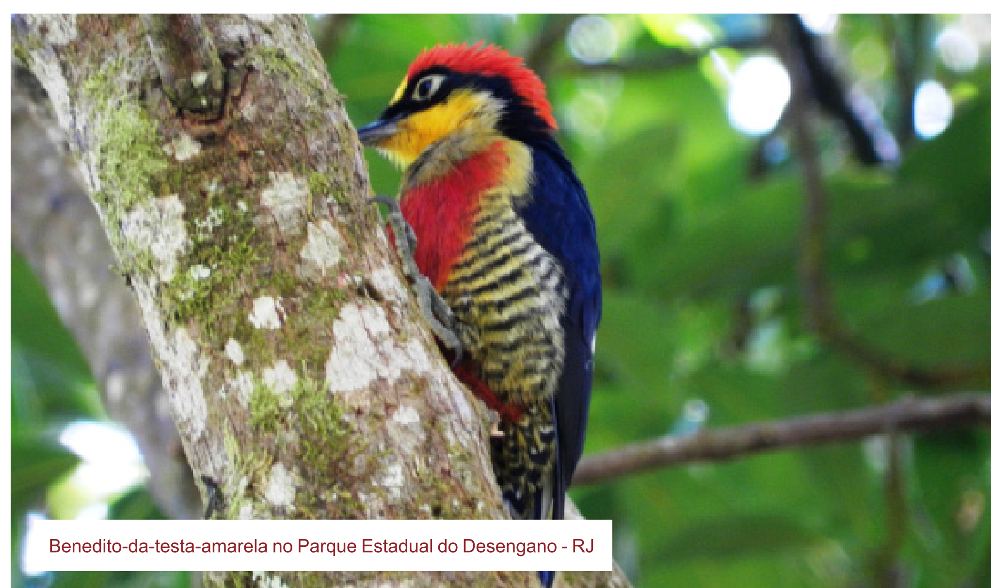
Benedito-da-testa-amarela no Parque Estadual do Desengano - RJ

Vivem normalmente na companhia do homem. Exemplos: cachorro, gato e galinha.