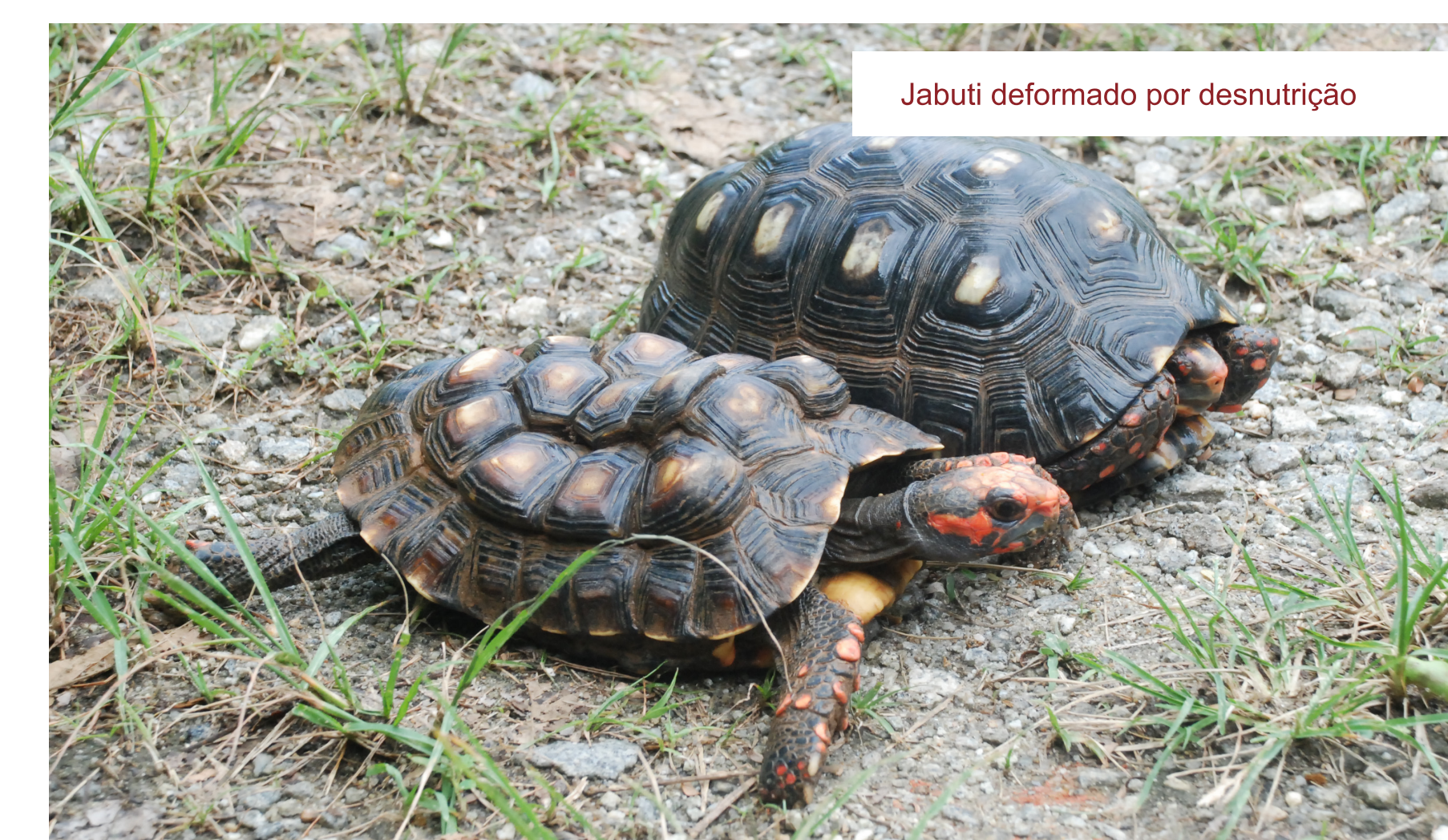
Jabuti deformado por desnutrição

Não compre animais em feiras, nem à beira de estradas.