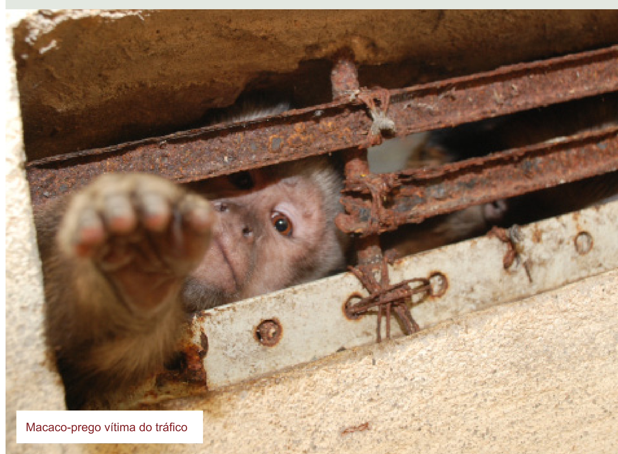
Macaco-prego vítima do tráfico