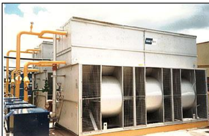
Figura 2. Condensador

7.2.3 O evaporador consiste geralmente de uma série de tubos, as serpentinas, que se encontram no interior do ambiente a ser resfriado. A amônia sob forma líquida evapora-se nesses tubos, retirando calor do ambiente na passagem ao estado gasoso. Sob a forma gasosa, volta ao condensador pelo compressor, fechando assim o ciclo.