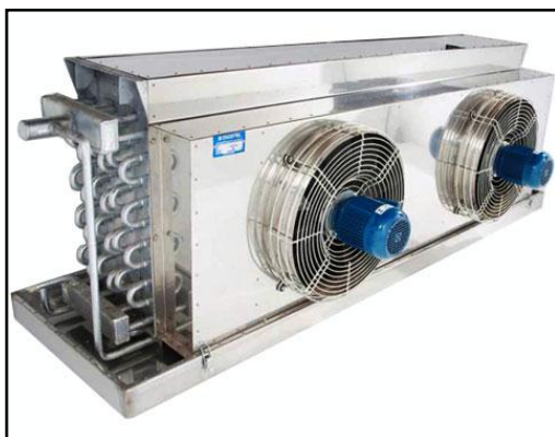
Figura 3. Evaporador

7.2.3 O evaporador consiste geralmente de uma série de tubos, as serpentinas, que se encontram no interior do ambiente a ser resfriado. A amônia sob forma líquida evapora-se nesses tubos, retirando calor do ambiente na passagem ao estado gasoso. Sob a forma gasosa, volta ao condensador pelo compressor, fechando assim o ciclo.