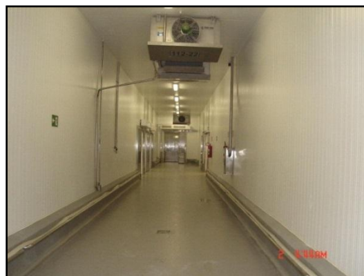
Figura 4. Evaporadores em câmaras frigoríficas

Nota: No anexo 1 é apresentado Checklist com os dados da composição do sistema de refrigeração por amônia bem como respectivos parâmetros a serem observados pelo empreendedor durante as etapas de manutenção.