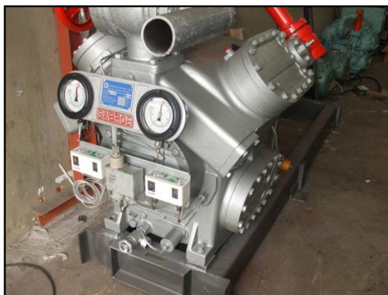
Figura 1. Compressor

7.2.1 O compressor é geralmente constituído por uma bomba dotada de um tubo de aspiração e compressão, possuindo um dispositivo que impede fugas de gás e entrada de ar atmosférico. Situado entre o evaporador e o condensador, aspira a amônia evaporada e a encaminha ao condensador sob a forma de um vapor quente sob pressão elevada.