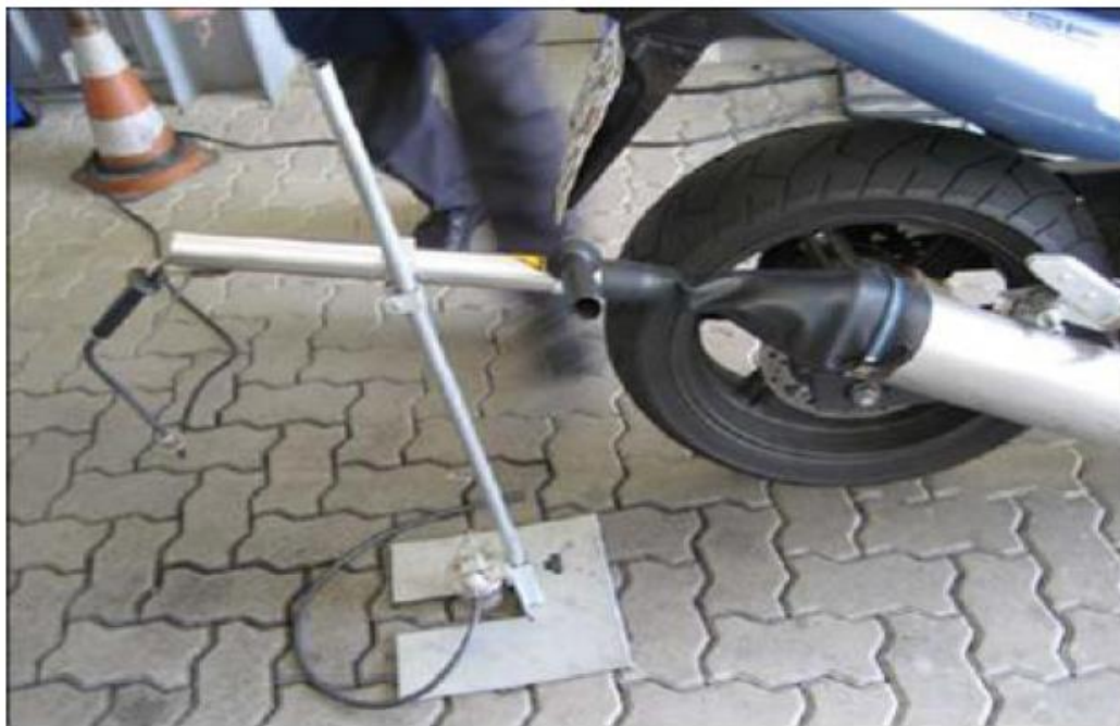
Figura 3 – Exemplo de Adaptador de extensão com vedação externa

A Figura 3 apresenta um exemplo de adaptador externo flexível.